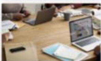
Gestion du Club