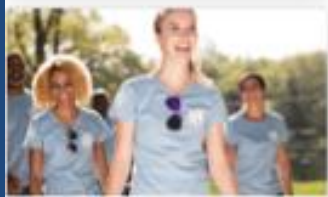
Rapport d'Activité de Club