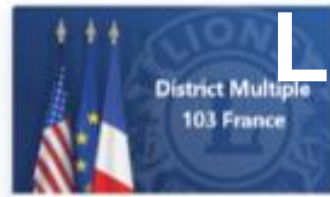
DM 103 France