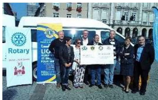
Remise du Véhicule au CCAS

La prochaine édition du salon est prévue les 3 et 4 février 2018, venez nombreux découvrir les très bons produits du terroir de notre beau Pays.