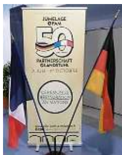
Soirée 2017 le poster du jumelage