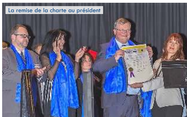
La remise de la charte au président