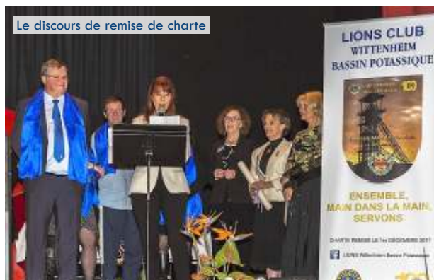
Le discours de remise de charte