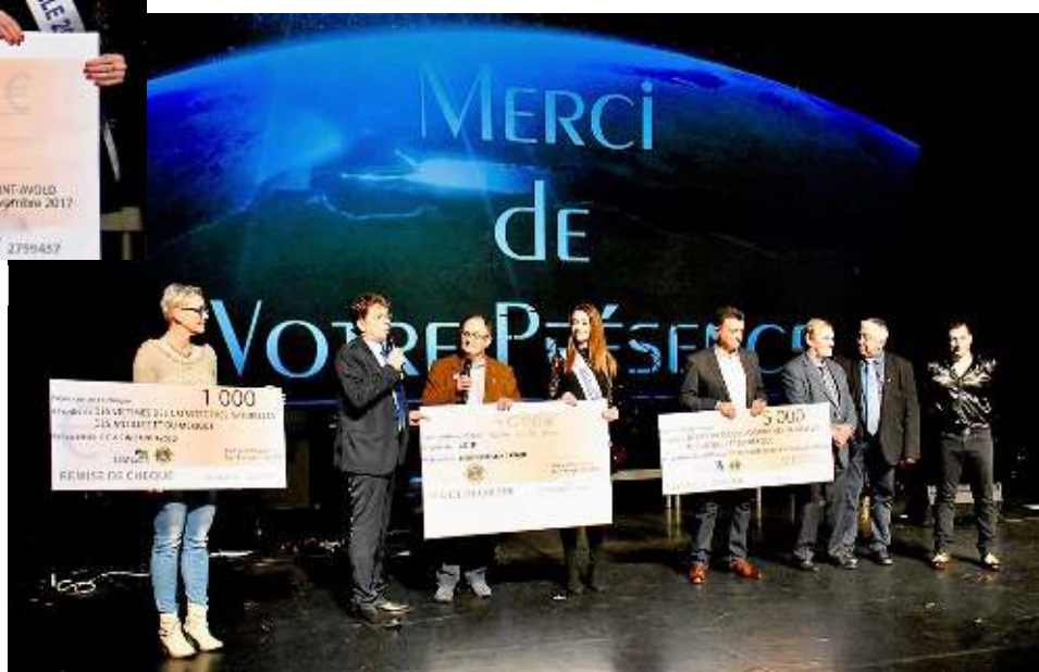
3 chèques : 10 000 €