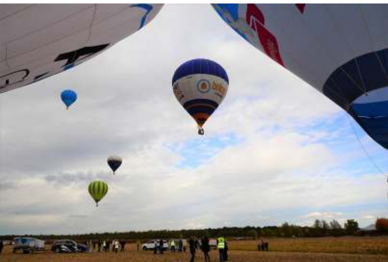
Envol des montgolfières

« Une expérience qui permet aussi de renforcer les liens entre les enfants et leurs éducateurs », « quelque chose d'extraordinaire pour les sortir de leur quotidien » : expressions entendues et reprises par la journaliste de la presse régionale dans un grand et bel article, intitulé « La Cité de l'Enfance prend son envol », qui concluait : « Une belle opération solidaire qui a ravi tous les participants ».